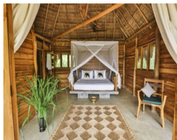
Gal Oya Lodge

Flüge mit anderen Fluggesellschaften sind jederzeit möglich! Diese Reise wird mit einem Emirates Special Tarif angeboten. Fragen Sie die aktuellen Specials an.