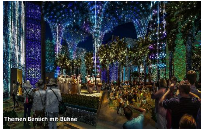
Themen Bereich mit Bühne

Als Besucher dieser besonderen EXPO dürfen Sie viele Attraktionen, Kunst & Kultur, Events, Shows, attraktive Themen & Pavilions, tolles Essen und Shopping erwarten.