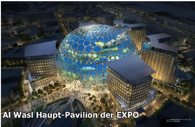
Al Wasl Haupt-Pavilion der EXPO