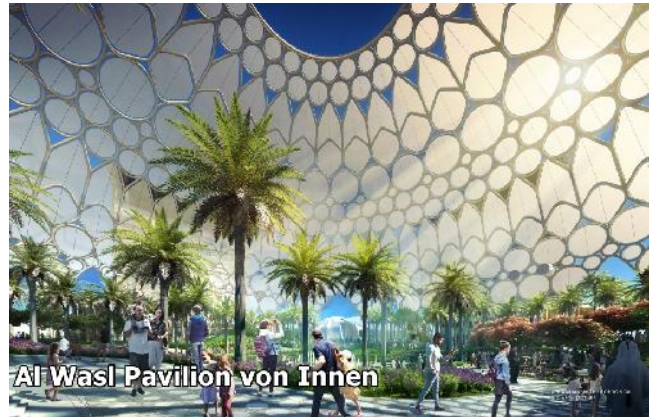
Al Wasl Pavilion von Innen

Dubai - die Metropole steht für Zauber des Orients spüren und das Besondere erleben!