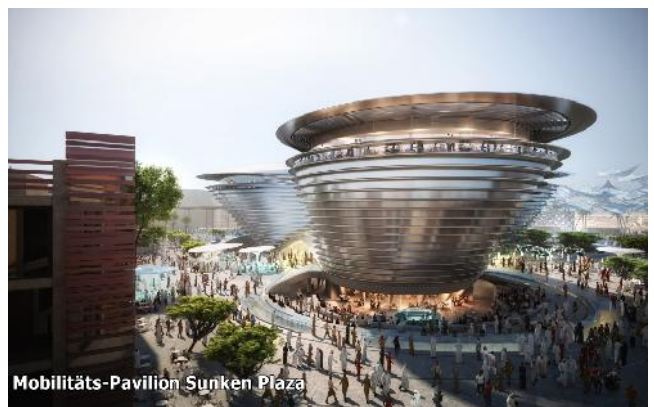
Mobilitäts-Pavilion Sunken Plaza

an Wochenenden und Feiertagen von 10 - 2 Uhr